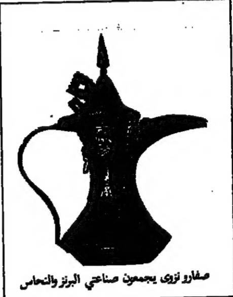
صغار نزي يجمعون صناعات البرنز والنحاس